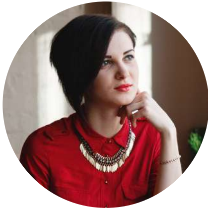
JÓVENES 18 a 30 años