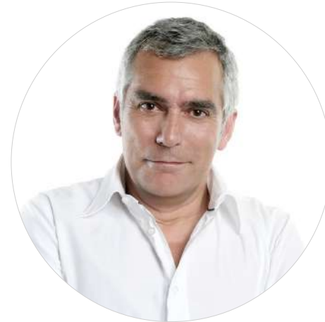
DESEMPLEADOS 30 a 55 años